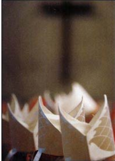
Celebrazione eucaristica in San Pietro.

dove il consenso supera la materialità dei contenuti, che possono restare anche non del tutto perfetti, ed è invece il vero senso della Chiesa come sacramentum unitatis reso possibile dallo Spirito: sinfonia spirituale». E allora, ha spiegato Ruggieri, «si esige una conversione da tutti, pastori e fedeli. Il futuro della Chiesa e della sua vitalità evangelica non sta in una religione civile, ma in una Chiesa della partecipazione nella comune responsabilità verso il Vangelo che abbiamo ricevuto».