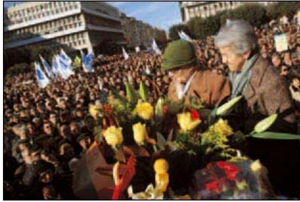
Un'immagine dei funerali di Piergiorgio Welby, a piazza San Giovanni a Roma.

Non un gesto di protesta, dunque, o la stanca riedizione di manifestazioni di dissenso ecclesiale, ma il desiderio di confrontarsi sullo stato di salute della comunità cristiana, di condividere le proprie fatiche nel cammino, di «confermarsi a vicenda nella fede». Che una tale impostazione fosse quella giusta, in sintonia con i sentimenti e il vissuto di ampi strati del mondo cattolico italiano, lo si è visto dalla mole di risposte all'invito, fatto circolare in maniera piuttosto artigianale via e-mail: decine di gruppi locali, di realtà diocesane, parrocchie e anche singoli fedeli hanno aderito con entusiasmo all'idea dell'appuntamento fiorentino. E oltre 40 sono stati gli interventi scritti inviati da ogni parte d'Italia come contributi alla riflessione per l'incontro.