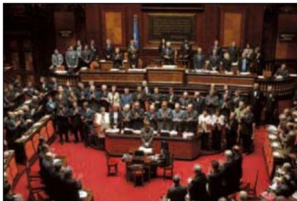
Un'immagine della Camera dei Deputati.