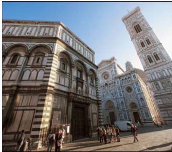
Uno scorcio di Firenze con le splendide architetture del Battistero e della Cattedrale (foto P. Ferrari/Periodici San Paolo).

Amore e sofferenza. Passione per il Vangelo e la Chiesa, da una parte. Ma anche disagio per il modo in cui la comunità ecclesiale viene guidata, gestita e percepita. È tutto qui, in questo binomio di amore e sofferenza, il senso profondo dell'incontro che si è svolto il 16 maggio a Firenze, sul tema Il Vangelo che abbiamo ricevuto . Un incontro radicalmente nuovo e potenzialmente centrale, per il futuro della Chiesa italiana. Eppure un appuntamento sottovalutato e trascurato, sia dai grandi media sia dagli organi di stampa ecclesiali.